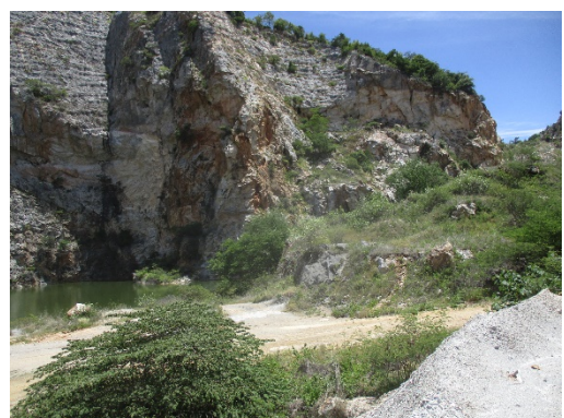
ลักษณะภูมิประเทศพื้นที่โครงการ